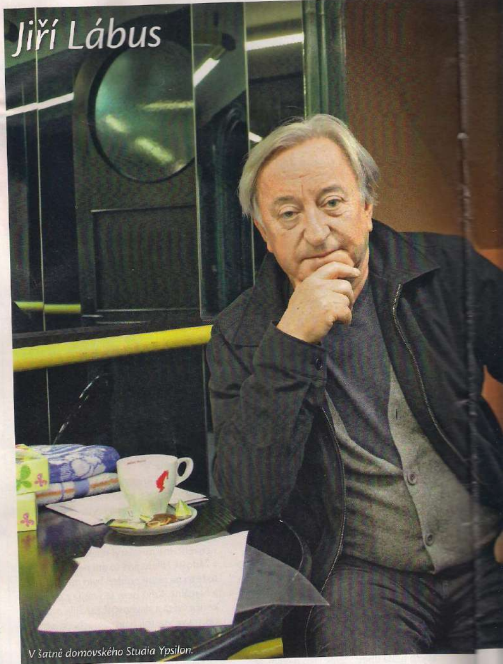
V šatně domovského Studia Ypsilon.

Divadlo Kalich uvádí hru Don Quijote , kde hrajete titulní postavu idealisty a snílka. Nechtěl byste si raději zahrát přízemního Sancha Panzu?